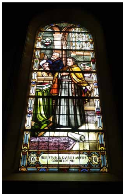
Gebrandschilderd raam in de lutherse kerk van Groningen.

Van 1515 tot 1519 waren er misoogsten in Wittenberg. De speculanten dreven de prijzen voor het voedsel enorm op. Als reactie schrijft Luther in 1519 een boek waarin hij ageert tegen de woeker. Uitgangspunt voor Luther is, dat bij een lening de relatie tussen geldgever en geldnemer en onderpand centraal moet staan. De geldnemer heeft daarbij ook inspraak in de wijze en moment van terugbetaling. Als Luthers opvattingen nu nog algemeen aanvaard zouden zijn, was de huidige crisis waarschijnlijk niet ontstaan omdat de relatie in veel gevallen volledig verloren is gegaan en geldgevers vaak eenzijdig tot executie overgaan.