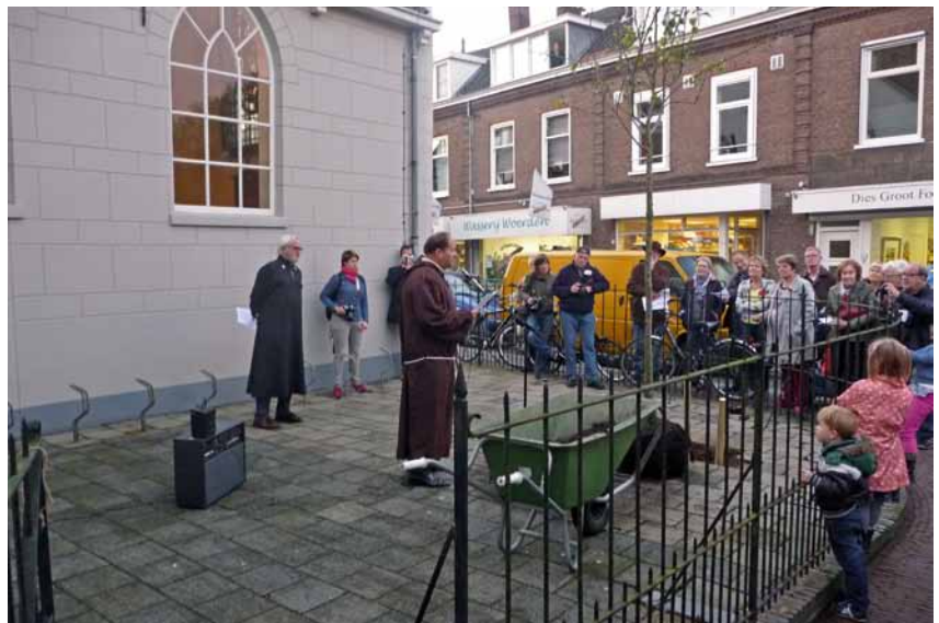
Op 31 oktober werd onder grote belangstelling een appelboompje gepland door 'Luther' (rechts) en 'Tetzel' (links).

In een gemeente met veel leden en gastleden die een bewuste keuze hebben gemaakt is een gesprek over de toekomst intrigerend. Een groot aantal van hen kent wijkgemeenten van calvinistische origine – soms recent, maar regelmatig ook van enige tijd geleden. Samenwerken met deze wijkgemeenten beperkt zich (dus) tot een aantal relatief 'makkelijke' onderwerpen. Roosters, de kerk openstellen voor avonddiensten, een gezamenlijk agenda voor de werkgroep 'Geloof en Cultuur' – diaco-