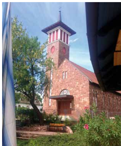
De accommodatie van de Lutherse Kerk in Hongarije, prachtig, aan het Balatonmeer.

Kerk, een krachtige eigenschap zijn. Minderheden worden in allerlei gremia gezien als groepen met rechten, rechten die in het leven geroepen zijn om te beschermen. Vaak worden ze afgeschilderd als slachtoffers van de meerderheid, als groepen die worden overvleugeld door meerderheden.