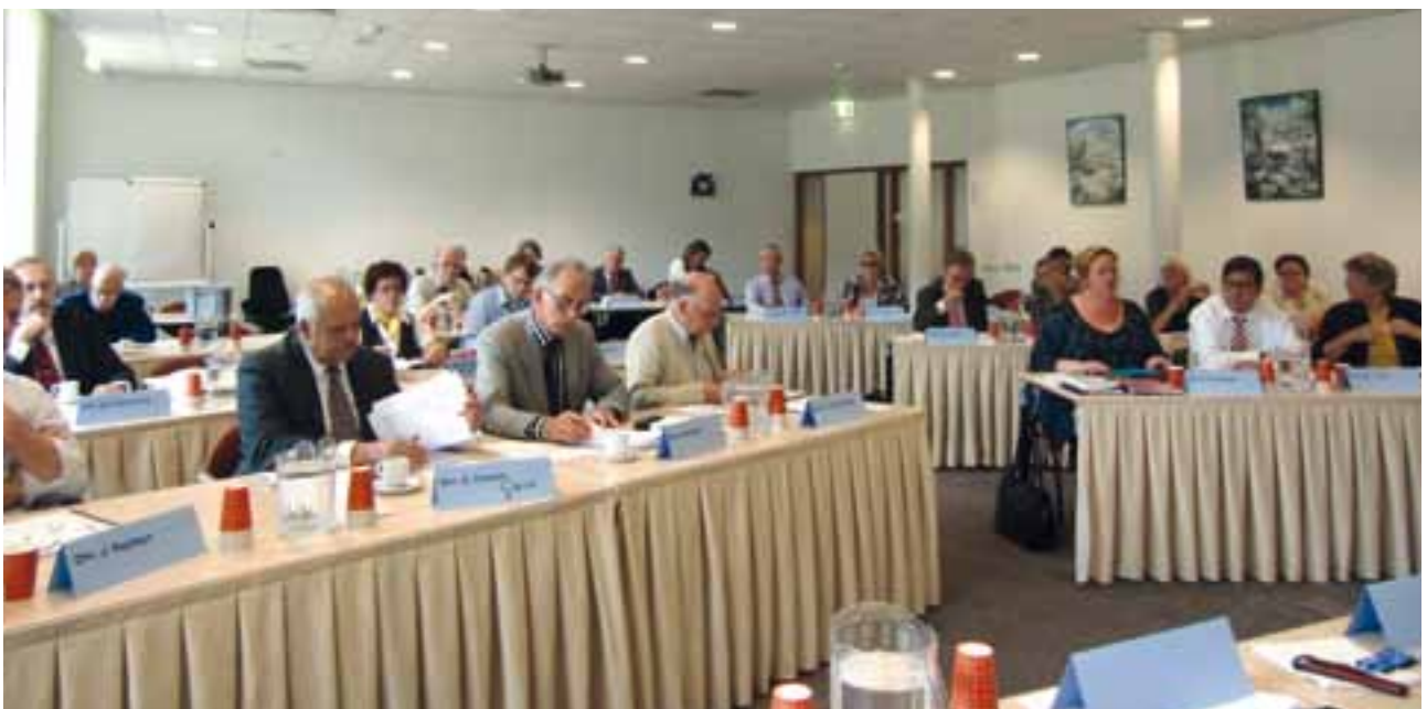
el-synode aan het werk