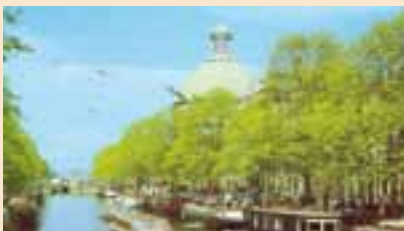
De Ronde Lutherse kerk