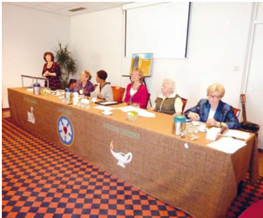
Van 'bond' naar 'beweging'? Het huidige bestuur van de NLVB.

De vrouwen treffen elkaar onder meer tijdens de jaarlijkse ontmoetingsdag, zoals afgelopen april in Nijkerk (zie ElkKwartal nr 2), met