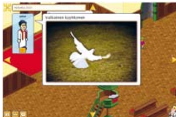
De website van de kinderkerk in Finland.