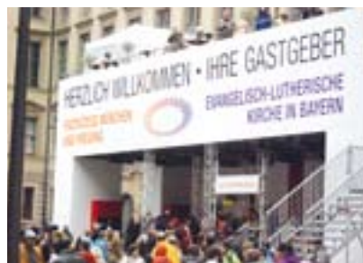
Mensen en oecumene in München, mei 2010.

Anders stond het met Margot Käßmann, die als voorzitter van de raad van de Evangelische Kirche in Deutschland en ook als bisschop van