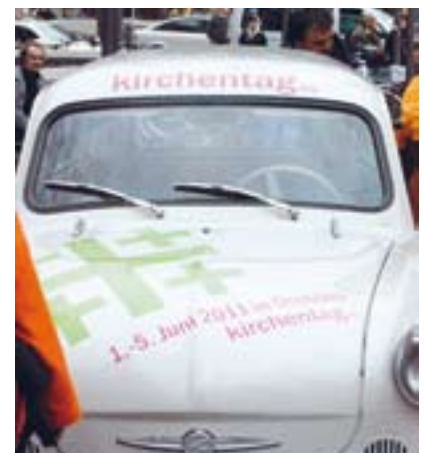
De volgende Kirchentag, de protestantse, zal begin juni 2011 plaats vinden in Dresden.