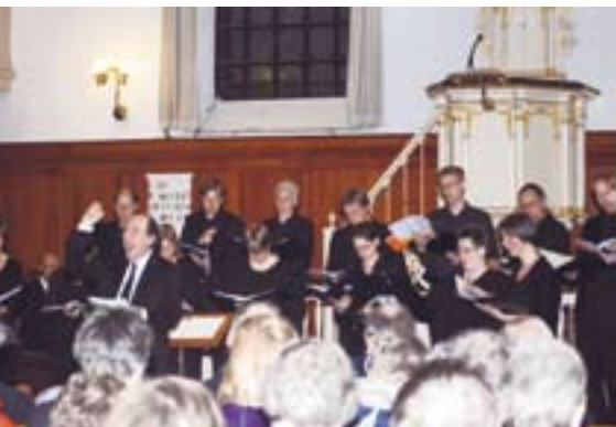
Zingen in de lutherse kerk in Utrecht.

Onder invloed van Luther ging men liederen gebruiken als middel om de kern van het evangelie over te dragen. Als er iets gemakkelijk uit het hoofd te leren valt is het wel een lied.