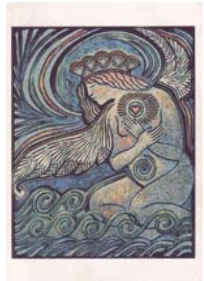
Prayer to the Sea, hand colored linoleum, blockprint, 8 x 10 in; 1994, Mara Fliedman.

Het liefst betrek ik de ervaring van mensen erbij. En ik herinner me hoe