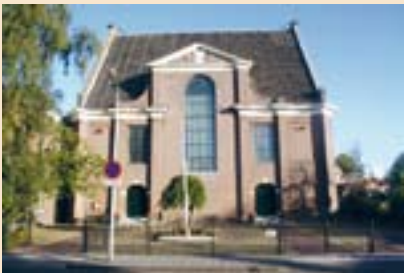
Kerk Zaandam

Er was veel te doen in ZAANDAM . Een afvaardiging van de kerkenraad woonde een classisvergadering bij, waar ze een presentatie verzorgde met een liturgisch moment. Daarna kwamen ze met een eigengemaakte puzzel. Alle goede antwoorden vormden samen het woord 'Maartenkerk', de naam die sinds enige tijd het kerkgebouw siert. Ook vierde een aantal gemeenteleden een fantastisch weekend. Geen referaten of zware problemen, maar heerlijk samen uit. Niet alles hoefde gezamenlijk te gebeuren. Wie wilde wandelen of naar een zwarte markt wilde kon dat doen, maar lekker thuisblijven in de bungalows waar gelogeed werd, kon ook. Tijdens de startdag van de gemeente op 22 september staat een dagtocht op het programma. Het wordt een tocht met een bezoek aan de lutherse kerk in Leiden en een vaartocht over de Kagerplassen.