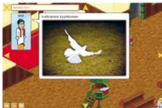
De website van de kinderkerk in Finland.