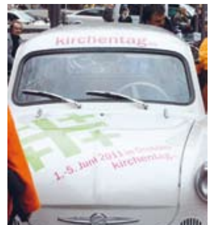
De volgende Kirchentag, de protestantse, zal begin juni 2011 plaats vinden in Dresden.