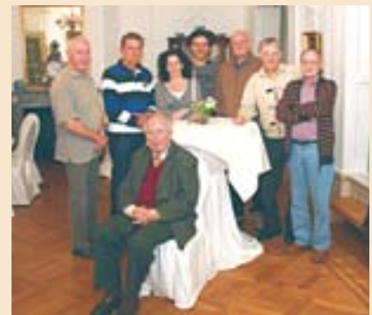
De besturen van het Luthers Buitencentrum en de Vrienden van Hoekelum.