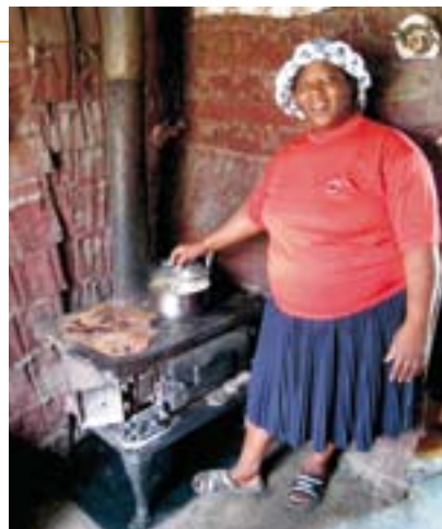
Zuid-Afrikaanse vrouw aan het koken in een eenvoudig oventje.

Basa Magogo is gestart in de gemeenschappen Embalenhle en Mpu-malanga. Sinds 2007 is het uitgebreid naar zestigduizend huishoudens. Inmiddels heeft NOVA met geld van FairClimate een aantal projectleiders en veldwerkers kunnen aantrekken. Allen die aan het project verbonden zijn, hadden geen baan en werden aangetrokken vanwege hun bereidheid