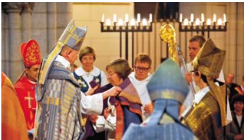
De wijding van bisschop Brunne in de kathedraal van Uppsala.

Zweedse Kerk. De beslissing die op synodaal niveau is genomen, zal nu in de plaatselijke gemeenten uitgevoerd moeten worden. Zweedse priesters zullen niet verplicht worden huwelijksvieringen van mensen van gelijk geslacht te leiden. Wel moet de gemeente waar de aanvraag voor zo'n huwelijk wordt ingediend ervoor zorgen dat het desbetreffende paar ook daadwerkelijk daar terecht kan voor het sluiten van hun huwelijk.