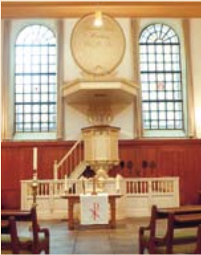
Interieur Lutherse Kerk Utrecht.