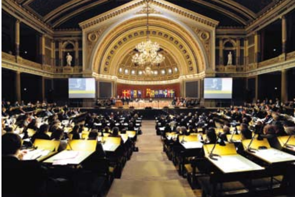
De synode van de Zweedse Kerk bijeen over het openstellen van het ambt voor mensen met een homoseksuele relatie.

Slechts twee weken na deze synodebeslissing volgde een andere opvallende gebeurtenis in Zweden. Op 8 november werd Eva Brunne (55 jaar), een vrouwelijke priester met een lesbische relatie, tot bisschop gewijd. Eerder dit jaar werd ze tot bisschop van Stockholm gekozen. Haar wijding in de kathedraal van Uppsala