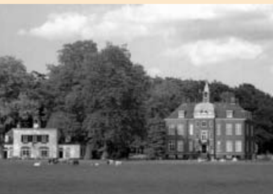
Hoekelum, Bennekom

In PURMEREND kon deze zomer uitgebreid kennis gemaakt worden met de lutherse kerk. De Vereniging Historisch Purmerend bood een door de stadshistoricus uitgezette stadswandeling aan, waarbij de lutherse kerk een van de geselecteerde bezienswaardigheden was. In groepjes van zo'n twintig personen bezochten ongeveer honderdvijftig mensen (grotendeels voor de eerste keer) de recentelijk gerestaureerde kerk. Gemeenteleden leidden de bezoekers rond en vertelden over het ontstaan van de gemeente. De deelnemers toonden veel belangstelling en er werden veel vragen gesteld en beantwoord. Er werd steeds een inleidend