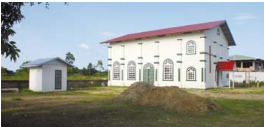
Het nieuwe kerkgebouw van de Evangelisch-Lutherse Kerk Suriname, de Gemeenschap van Hoop, Mottonshoop, Paramaribo is klaar. Alleen moet nog 4500 euro ingezameld worden voor een schutting. Maar schutting of niet, lutheranen en anderen zijn welkom in de kerk.

Mogen wij ons blijven openstellen voor Zijn leiding, voor Zijn Geest. Het werk gaat nu beginnen, want niet met hout en steen alleen is het grote werk gedaan, het zal om ons zelf gaan. Laten wij hoofden bij elkaar steken, handen reiken, voeten doen gaan en harten doen slaan en zo meewerken aan de zaak van God: Zijn Koninkrijk dat in ons en onder ons gestalte krijgt.