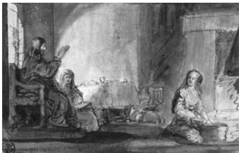
Jezus met Marta en Maria

De keuze van Marta accepteert Jezus trouwens ook. Hij vraagt niet aan haar, om er ook bij te komen zitten. Zij maakt een andere keuze. Zij doet iets, dat nodig is. Zij