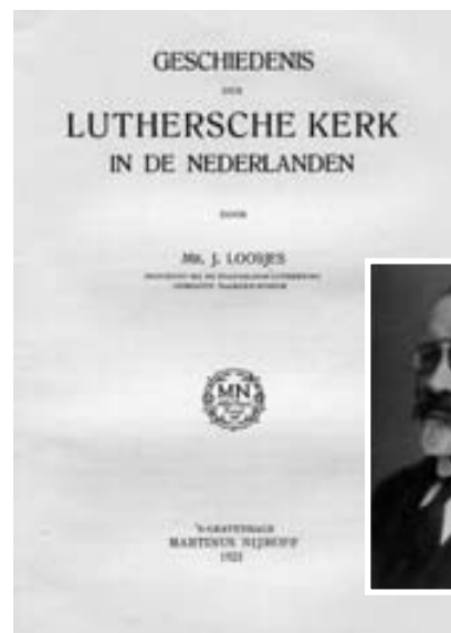
Titelblad van het standaardwerk over de Nederlandse lutheranen, dat volgens de werkgroep toe is aan vervanging.

Een andere hobbel werd de hoeveelheid materiaal van na 1920. Het ligt verspreid, er zijn veel niet gedocumenteerde artikelen en notulen. En juist in de jaren direct na 1920 is materiaal selectief bewaard. Om de literatuur over de geschiedenis van het Nederlandse lutheranisme beschikbaar te maken hebben we een database opgezet, die te vinden is op de